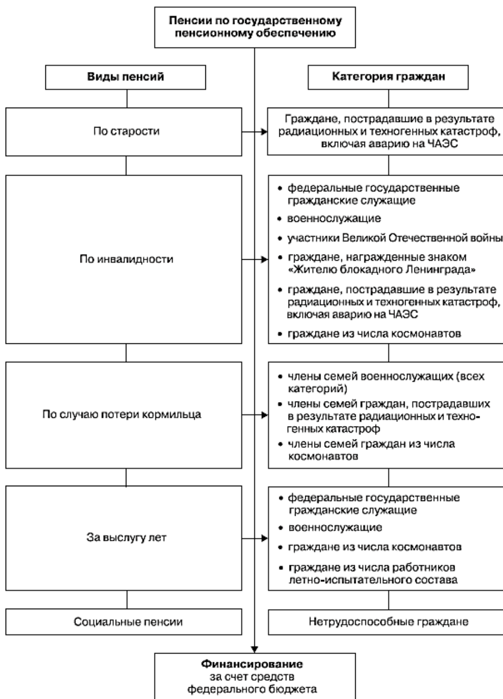
Рисунок Б.1 – Виды государственных пенсий