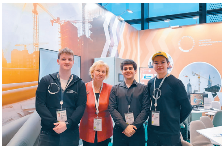
Образовательный стенд-тренажер «Цифровой электромонтаж» в Экспофоруме, 24-28 ноября 2023 год